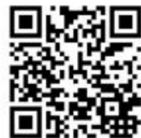
陕西金龙安全生产月活动