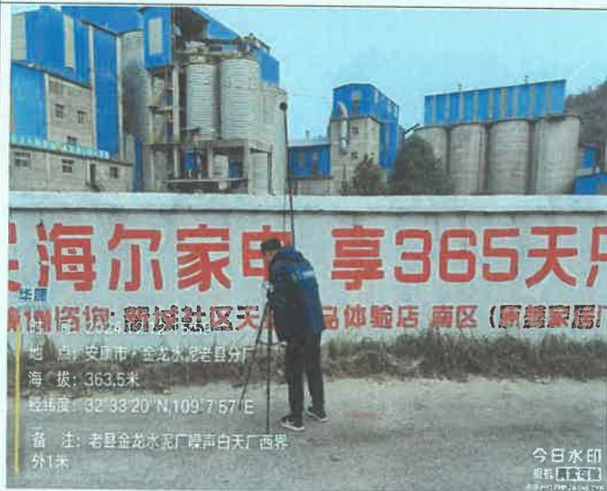
厂西界外 1m 处 (昼间)