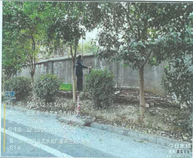
厂东界外 1m 处 (昼间)