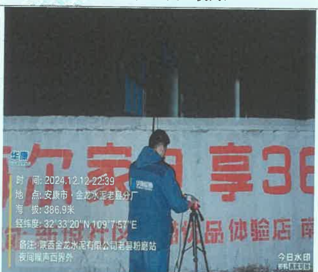
厂西界外 1m 处 (夜间)