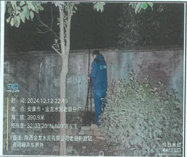
厂东界外 1m 处 (昼间)