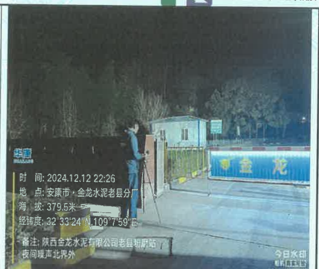
厂北界外 1m 处 (夜间)