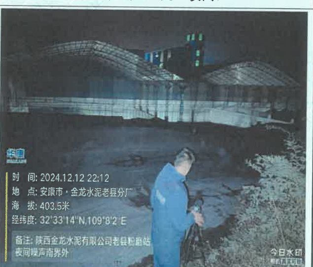
厂南界外 1m 处 (夜间)