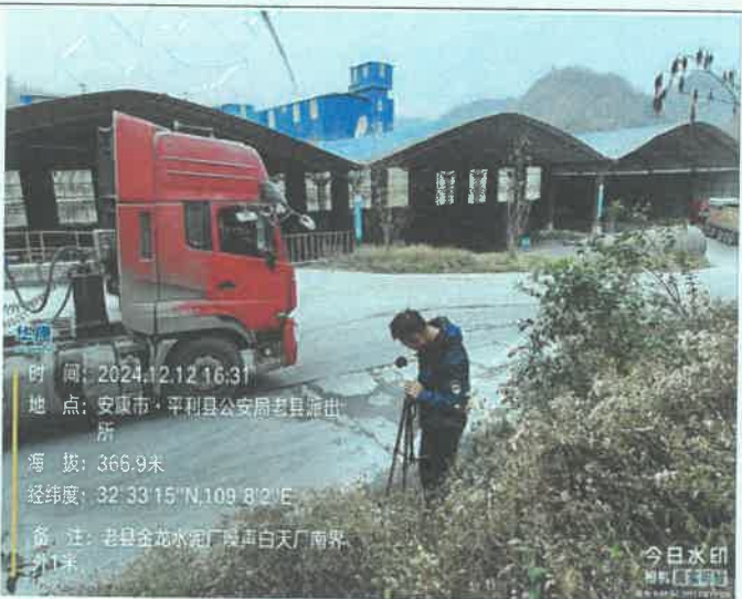
厂南界外 1m 处 (昼间)