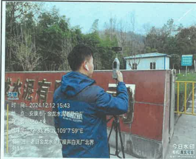
厂北界外 1m 处 (昼间)