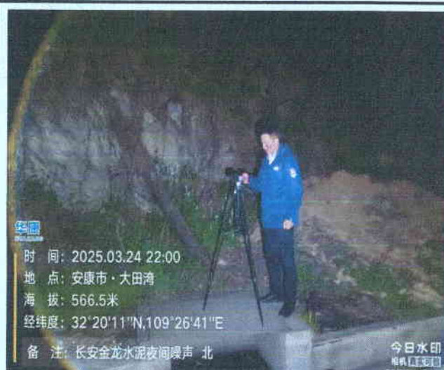
厂北界外 1m 处 (夜间)