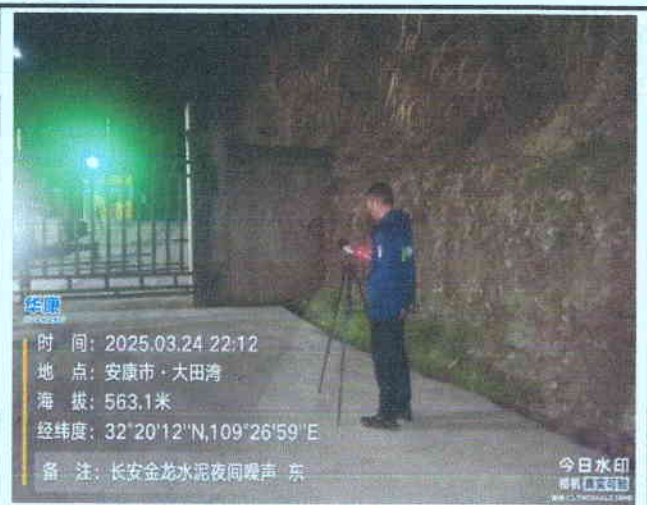
厂东界外 1m 处 (夜间)