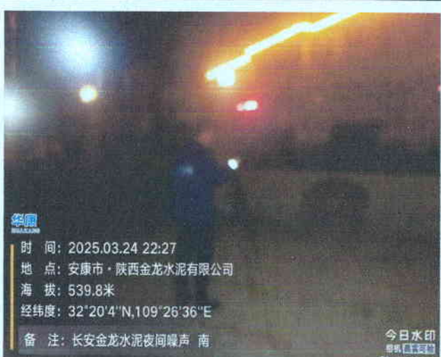
厂南界外 1m 处 (夜间)