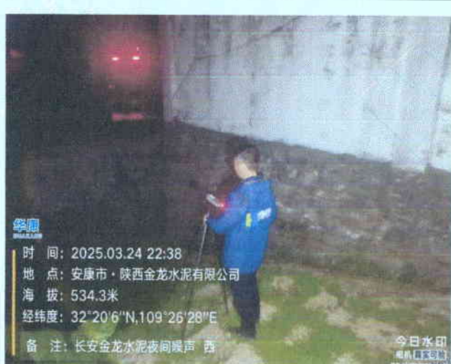
厂西界外 1m 处 (夜间)