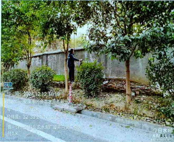
厂东界外 1m 处（昼间）