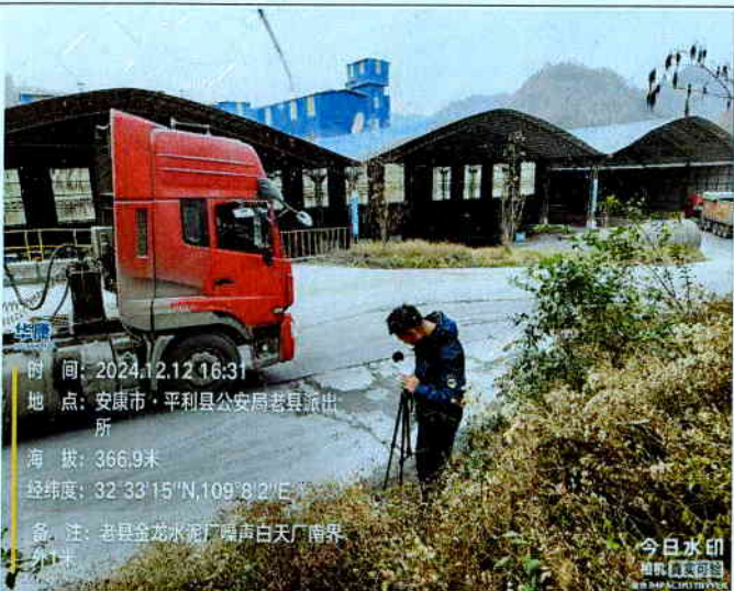
厂南界外 1m 处 (昼间)