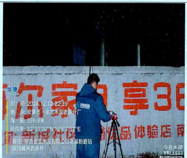
厂西界外 1m 处 (夜间)