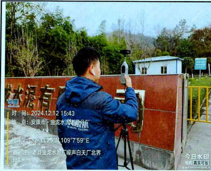
厂北界外 1m 处 (昼间)