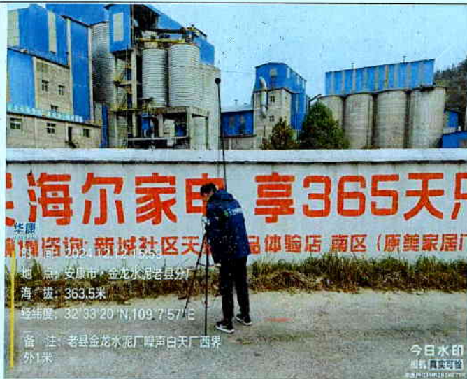
厂西界外 1m 处 (昼间)