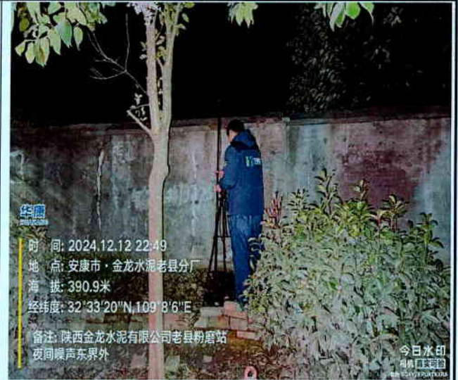
厂东界外 1m 处（昼间）