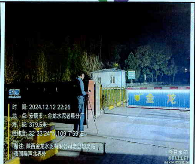
厂北界外 1m 处 (夜间)