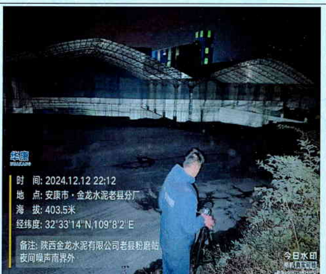
厂南界外 1m 处 (夜间)